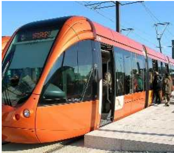
La première ligne s'étirera sur 13 km pour transporter 50.000 personnes par jour. Notre photo : le tramway du Mans, mis en service en septembre 2007.

Le nouveau réseau de bus, opérationnel en septembre 2009, prépare le terrain au chantier du tramway en 2011. La NR fait le point.